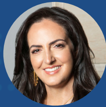
María Fernanda Cabal